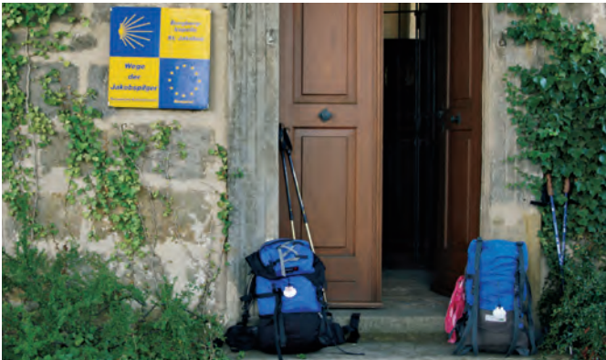
Burgbergkapelle St. Jakobus – Start des Jakobsweges von Lichtenfels nach Nürnberg

In der Kapelle können wir Jakob »Grüß Gott« sagen, bevor wir die Stufen zur Langen Straße hinabsteigen und rechts abwärts zur Bamberger Straße zurückkommen. Wir folgen ihr weiter nach links, gehen ziemlich lange auf dem Gehsteig der relativ viel befahrenen Straße entlang, nur als wir die Victor-von-Scheffel-Straße queren, werden wir abgelenkt, weil sie uns an das schöne Frankenlied erinnert, dessen Melodie sich